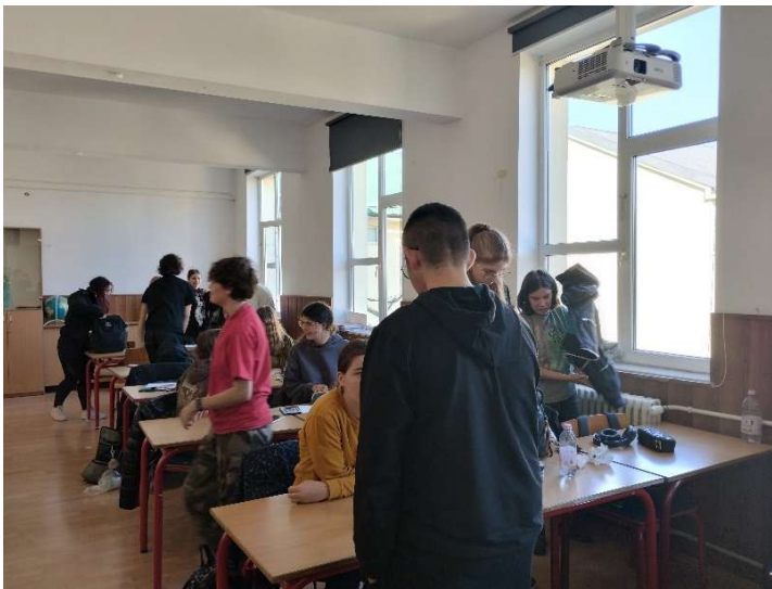
Випробування рецепту «Я» в художній школі «Ромулус Ладеа», Клуж-Напока

5 українських підлітків та 9 румунських підлітків відповіли на пропозицію як спільний проект, працюючи разом та ділячись результатами.